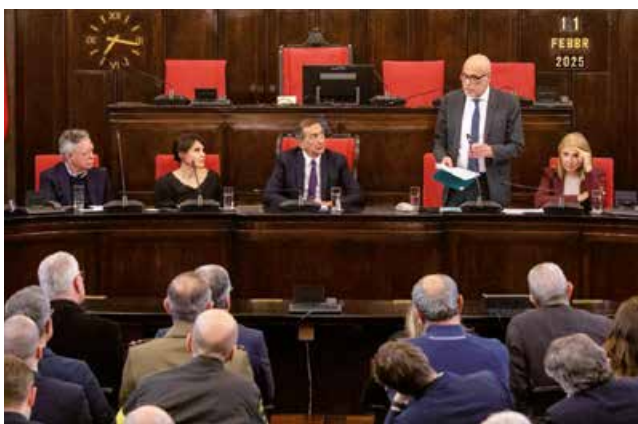
Nella foto, a destra del Sindaco di Milano, Sala, il Procuratore Viola e il Sostituto Procuratore Cerreti

territorio, dimostra che la collaborazione fattiva tra istituzioni civili, militari e le comunità di cittadini, può facilitare il lavoro investigativo e repressivo della Magistratura e indebolire la penetrazione delle associazioni mafiose nel tessuto sociale ed economico delle città.