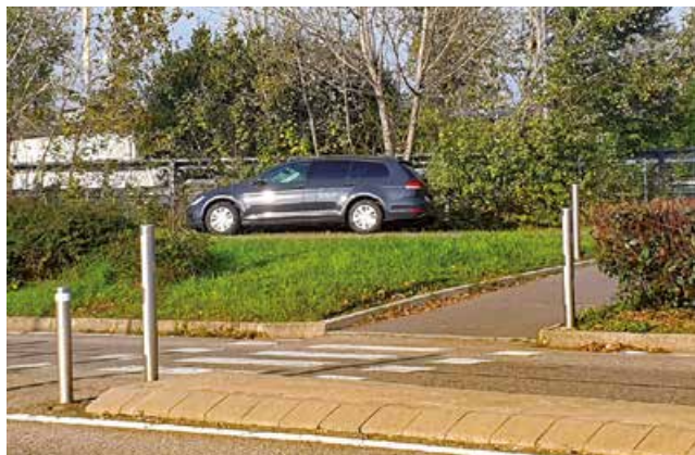
Il Comune di Pero ha dichiarato guerra al parcheggio selvaggio

S ono trascorsi nove mesi da quando questa nuova Amministrazione si è insediata. I primi interventi sono stati quelli che hanno riguardato la sicurezza del territorio, visibilmente messa a rischio da numerosi eventi che tutti hanno potuto osservare.