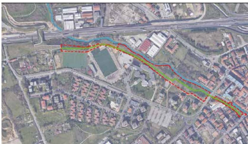
Nell'immagine, il perimetro della Green Line

Lombardia "Interventi finalizzati all'avvio di processi di rigenerazione urbana". La riqualificazione dell'area si inserisce all'interno di