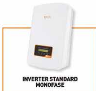
INVERTER STANDARD MONOFASE