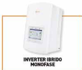
INVERTER IBRIDO MONOFASE

Scopri l'ampia gamma di prodotti necessari a completare il tuo progetto come staffe di fissaggio, cavi, connettori, quadri di stringa in Ac e Dc