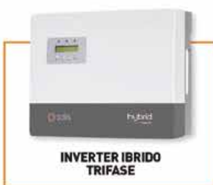
INVERTER IBRIDO TRIFASE