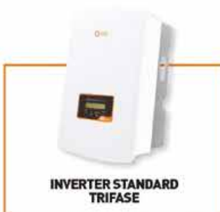
INVERTER STANDARD TRIFASE